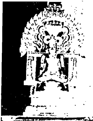
“ श्रीची उत्सवमूर्ति ”